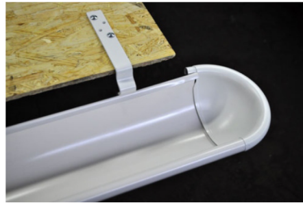
5. Опустите заглушку в желоб, чтобы окантовка легла внутрь желоба.