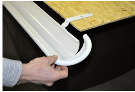
2. Вставьте завиток полукруглой заглушки в завиток желоба.