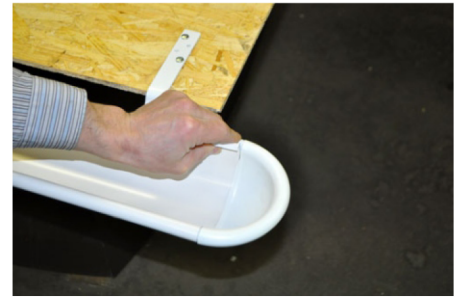
6. Плотно прижмите рукой заглушку к желобу.