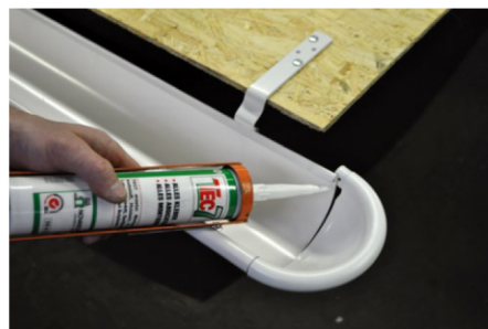
8. Отведите заглушку от желоба, не вынимая ее, и нанесите на стык клей