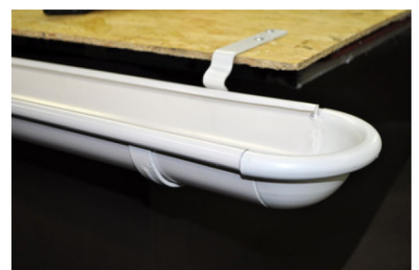
11. Удалите остатки клея в стыке желоба и заглушки.