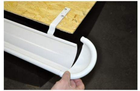
3. Проверните заглушку на себя в противоположную сторону от желоба.