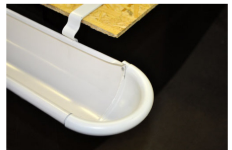
9. Прижмите плотно заглушку в желоб.