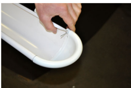
10. Установите вытяжную заклепку в отверстие.