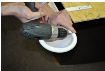
7. Просверлите отверстие под заклепку в желобе и заднем завитке заглушки.