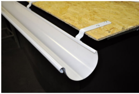
1. Установите желоб в крюки.